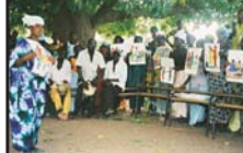
Strategien: „porte à porte“ und Dorfversammlung