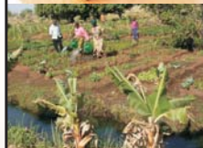
Beschneiderinnenseminar Kreditvergabe Alternative: Hühnerzucht oder Gemüseanpflanzung